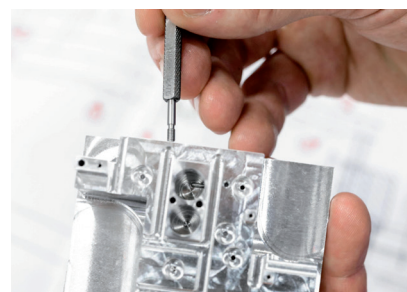
Pièces usinées de haute précision