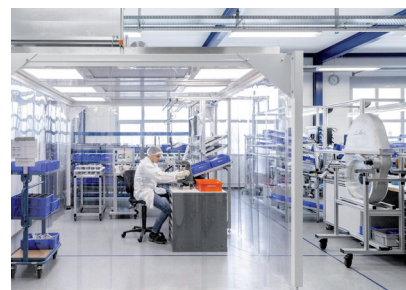
Montage von Baugruppen und Modulen

Tiefenackerstrasse 50, 9450 Altstätten Barzloostrasse 1, 8330 Pfäffikon (ZH) www.pwb.ch , info@pwb.ch