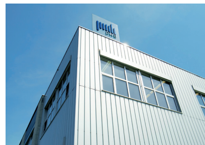
Standort in Altstätten und Pfäffikon (ZH)