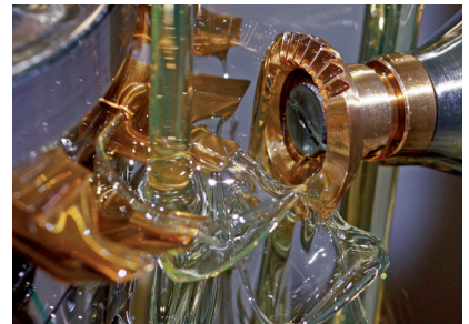
Propre production et montage

Développement, fabrication et distribution d'exécutions standards et particulières de composants de denture, pignons, vérins à vis et transmissions à roues coniques, transmissions spéciales ainsi que d'autres composants de la technique d'entraînement.