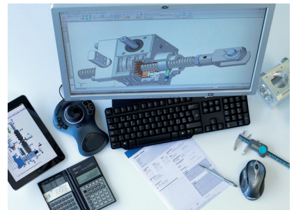
Une solution d'entraînement pour chaque situation