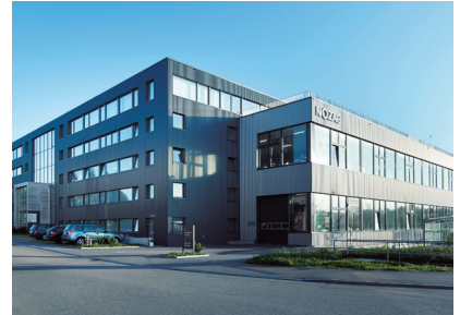
Site de production à Pfäffikon (ZH)